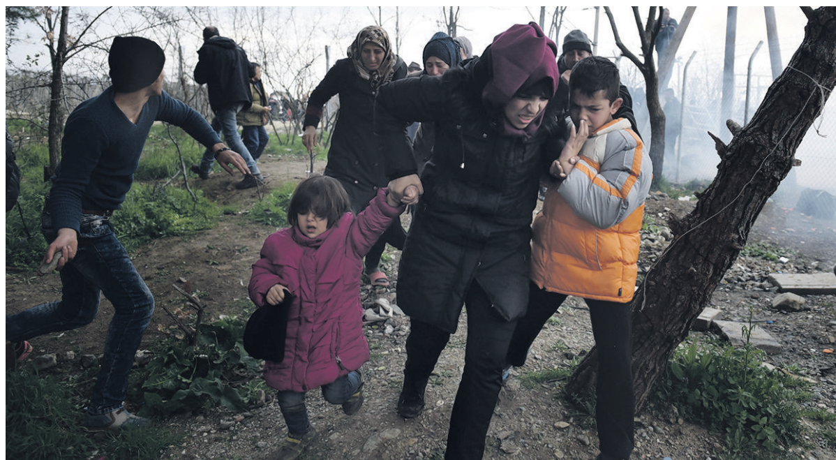
Macedonische politie schiet met traangas op vluchtelingen aan de grens met Griekenland.