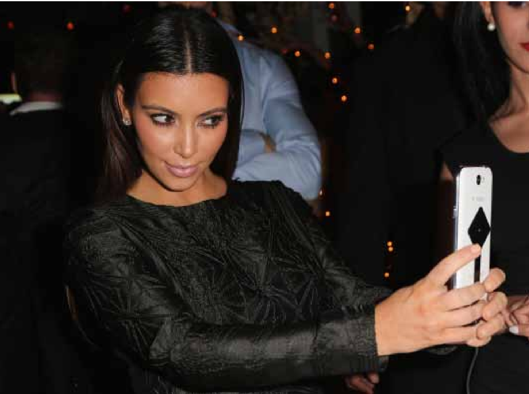
Kim Kardashian en haar Samsung Galaxy Note II